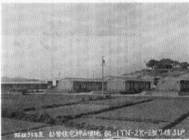
昭和39年度 町営住宅神山団地 64-1TN-2K-2室7棟31戸

公営住宅建設計画に基づき建設とするものです。この団地は通り渡り委員会、抽籤を経て入居中の神山団地第二期工事も昨年八、動、進捗等の交通の便は勿論開通者も決定しようとしております。以上三ヶ年計画で進めて来た同団地も昨年完成の二十戸に加え大部分が出来上がったわけですね。