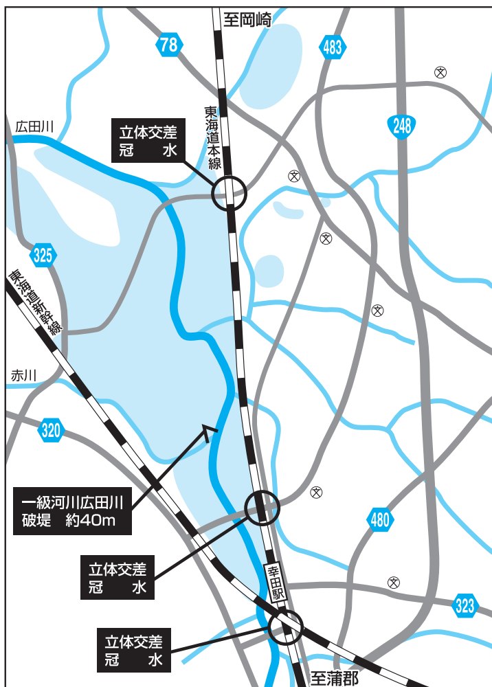
町内の主な冠水等の状況図