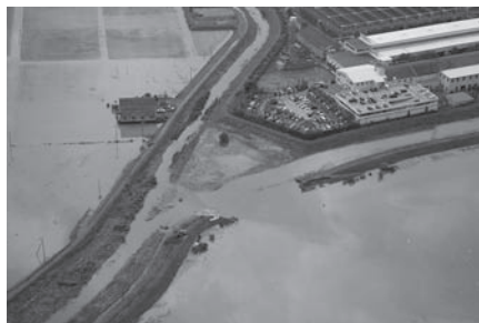
▲菱池の前田川(防災広場、菱池保育園東)