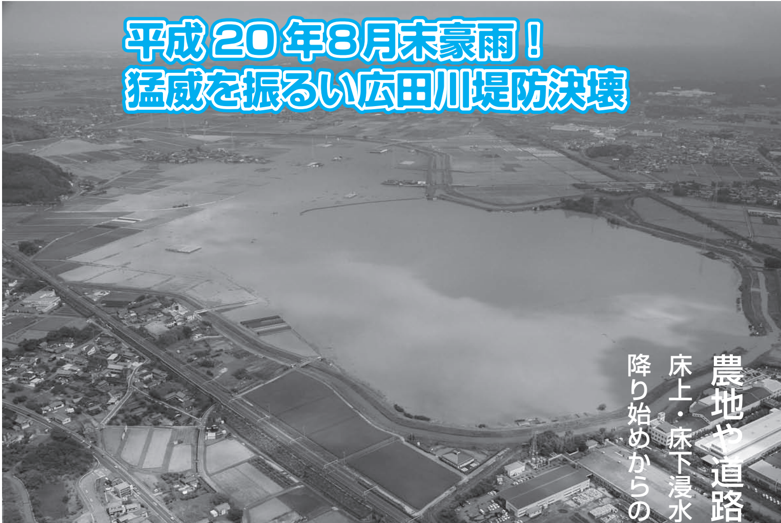
赤川・広田川合流地点の堤防が決壊し冠水した現場▲▼

農地や道路などに甚大な被害 床上・床下浸水など約120棟の家屋に被害 降り始めからの総雨量は404ミリに