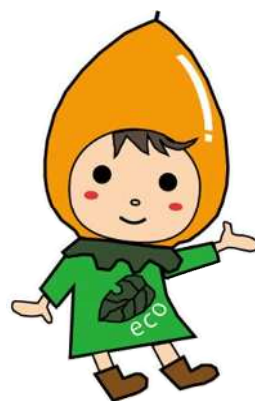
幸田町マスコットキャラクター エコたん