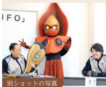
別ショットの写真

今月の表紙は、幸田町商工会で行われた劇場映画「突撃！隣のUFO」の制作発表会の様子です。河崎実監督、キャストのヨネスケさん、濱田龍臣さんなどが登壇し、制作の意気込みを語ってくださ