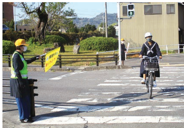
↑横断歩道での立哨活動