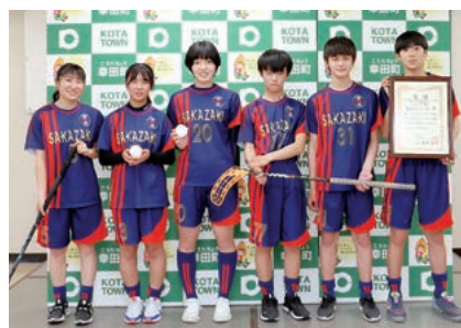
↑坂崎ブルービースト