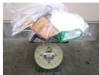
↑ミックスペーパー 約1.3kg

一人一人のちょっとした心掛けで、燃やすごみの量を減らすことができます。分別の徹底にご協力よろしくをお願いします。