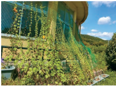
↑里保育園の緑のカーテン (令和3年度)

町では「あいち森と緑づくり環境活動・学習推進事業」の取り組みの一環として役場庁舎、福祉施設、教育機関などの各施設で緑のカーテンを設置しています。