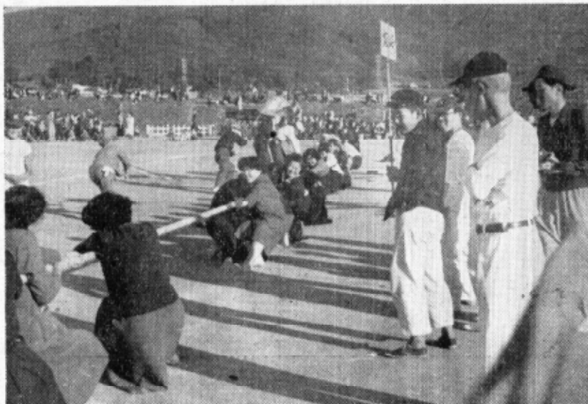
おかあちやんしつかり (綱引のひととき)

優勝 28年度 荻谷 29年度 大草 30年度 豊坂 31年度 菱池 32年度 ?