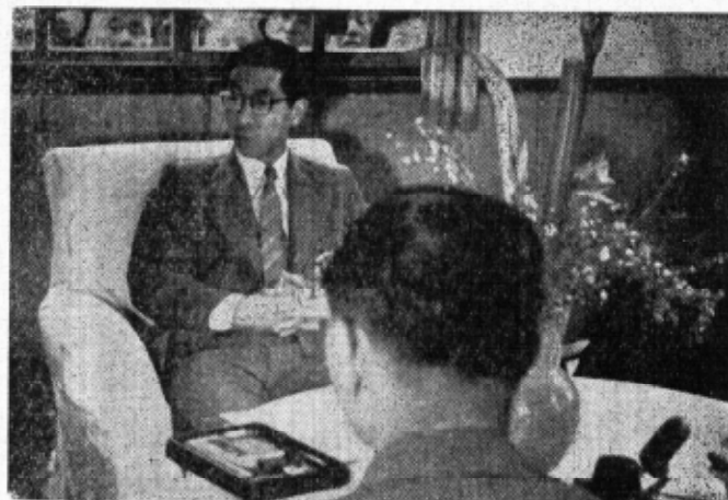
三笠宮崇仁親王殿下