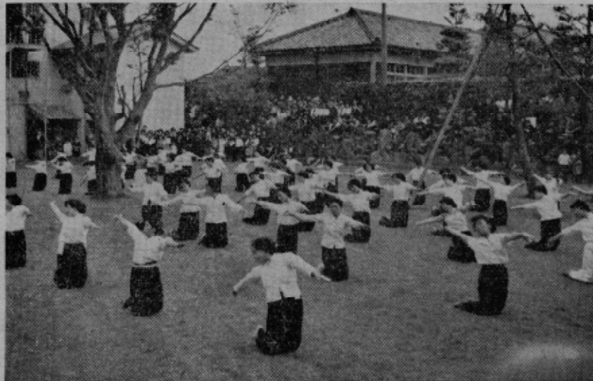
美容体操にしたしむおみなたち

私たちが幸田町の母は、この母の日に母としての立場で子供たちから感謝をうけるより先に、先づ子としての立場で私たちを育て、下さつた母や祖母たちの真心と御苦勞を思い、心から感謝の誠を捧げ、その真心に報いるためにも、更によい母となつて子供たちをよりよく育て上げることを誓ひたいと思ひます。