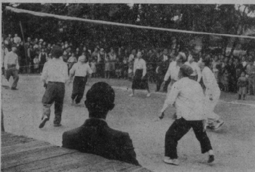
東海四県下のレクリエーション 権威者ら三〇〇名とともに 高力分館のバレー・ボール 御台覧