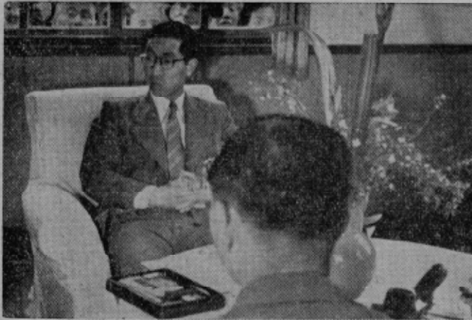
御少憩 町勢など御下問