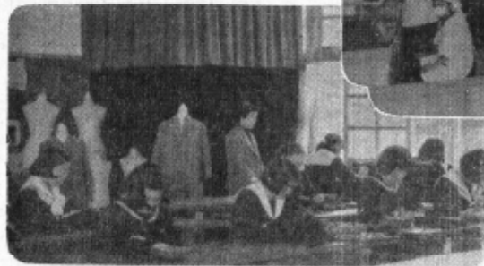
洋裁(スーツ)の作り方