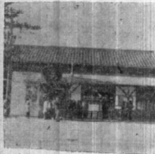
(旧 駅 舎)

本建てられる予定であります。便所は男子用、婦人用に別れ、待合室と便所との間は上家を設け更に跨線橋となぎますから、雨天の場合でも、車寄から乗降場まで雨具なしで御乗車願えることとなります。又鉄道弘済会の売店も待合室内に移転して、新駅舎にふさわしい装飾を施して、旅行用品、その他販売品も充実致しまして、皆様に御便宜を取計らうことになつております。 なお売店内に「委託公衆電話」を備付けまして、皆様に御利用して頂くよう手配致しております。