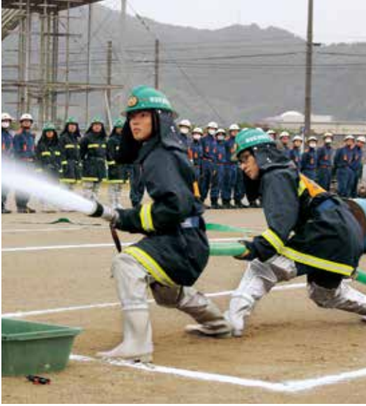
競練会で頑張る消防団員