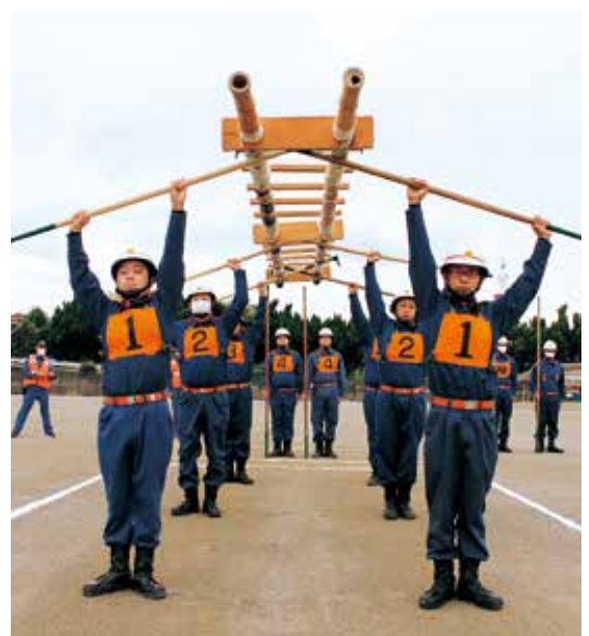
消防団員による階梯操法