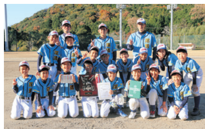
↑準優勝 深溝学区子ども会