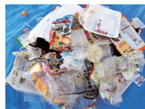
↑プラスチック製容器包装 約0.5キログラム