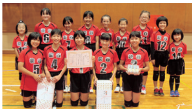
↑女子Bリーグ優勝 荻谷学区子ども会