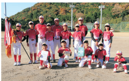
↑優勝 高力子ども会