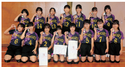
↑女子Aリーグ優勝 深溝学区子ども会

11月14日㊤に豊坂小学校体育館で子ども会ドッジボール大会が開催されました。昨年度は開催中止となり、1年越しの開催となった今大会は白熱した試合が繰り広げられました。本年度は新型コロナウイルス感染症の影響を考慮し、人数制限や無観客試合、3リーグ制による分散化を実施するなど対策を講じて開催しました。女子Aリーグ優勝は深溝学区子ども会、女子Bリーグ優勝は荻谷学区子ども会、男子リーグ優勝は深溝学区子ども会でした。