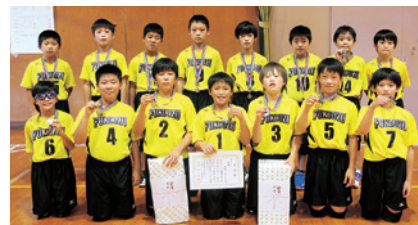
↑男子リーグ優勝 深溝学区子ども会