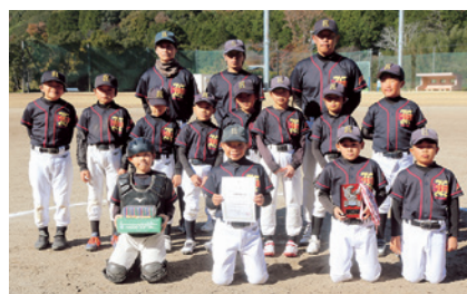
↑3位 岩堀北部子ども会