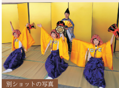
別ショットの写真