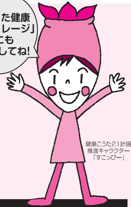
健康こうた21計画 推進キャラクター「すこっぴー」

人間ドック・脳ドック・肺ドック・各種がん検診等の申し込みを受け付けます。ご希望のかたは、申込書に必要事項を記入してお申し込みください。