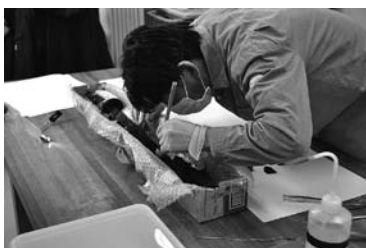
▲奈良文化財研究所で行われている出土品の整理作業