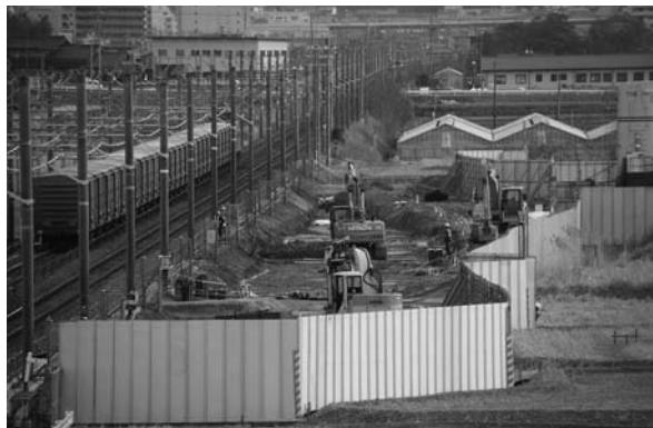
▲工事が開始された新駅