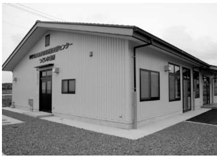
▲開設された 障害者地域活動支援センター つどい作業所