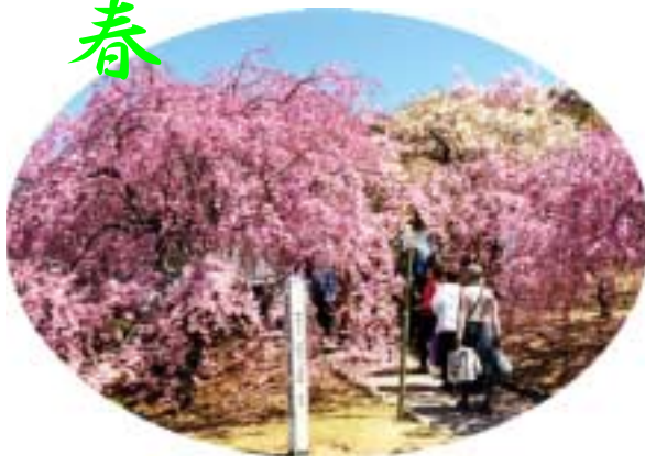
幸田文化公園の枝垂れ桜