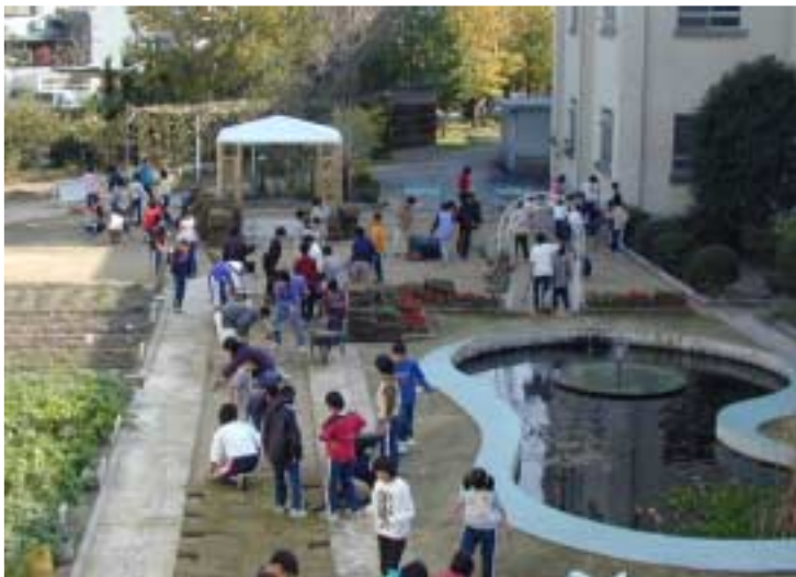
幸田小学校での ビオトープを含む中庭づくり

そこで、将来にわたり、よりよい環境を継承するため、幸田町の全ての人々がまちの環境と地球環境についての正しい知識を持ち、その上でお互いに協力しながら、一人ひとりが積極的に環境の保全と創造に向けて行動するまちを目指します。