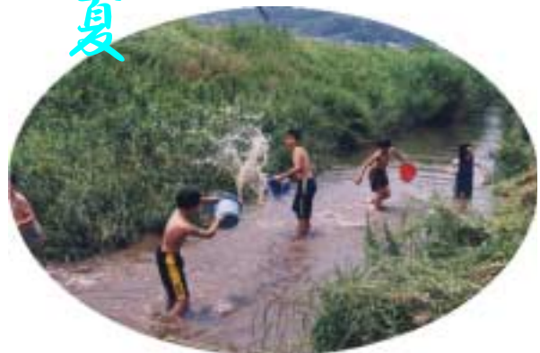
広田川での川遊び