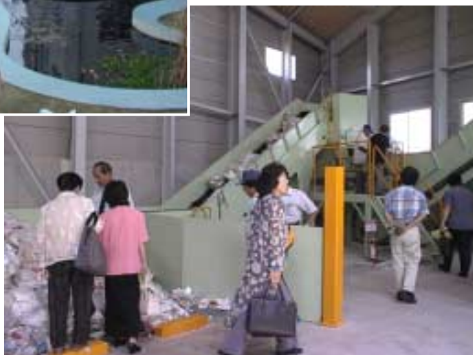
住民団体による リサイクル施設の見学