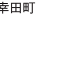
田圃ミュージアムライン