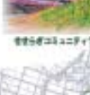
幸田町花いっぱい運動