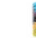
幸田町花いっぱい運動