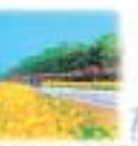
幸田町花いっぱい運動