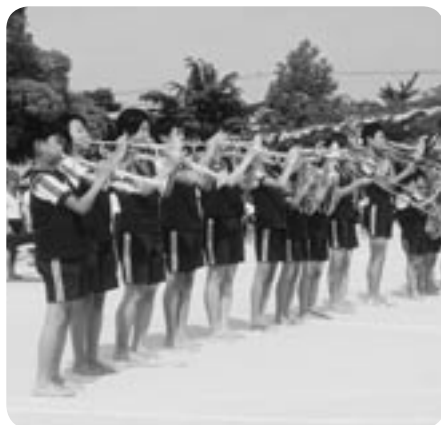
華やかなマーチングバンド 本校の運動会の開会式は、金管バンドのファンファーレで始まりま